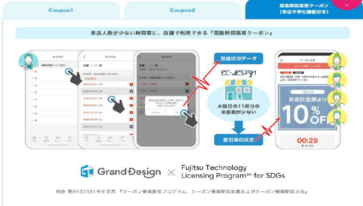
【図2】EC(電子商取引)アプリ制作パッケージツールへの適用