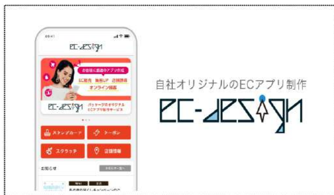
株式会社グランドデザイン製アプリ制作パッケージ