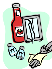
調味料、ドレッシング