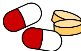
サプリメント、タブレット