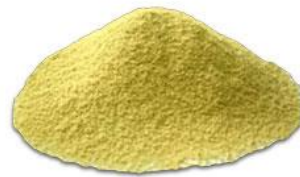
はっさくオイルエキス