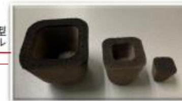
Ozo eater環境対応型 パフカル